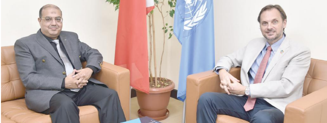
الممثل المقيم لبرنامج الأمم المتحدة الإنمائي في البحرين خلال حوار مع «الوطن»

إن بناء القدرات المحلية هو أحد الأهداف الرئيسية لوجودنا في البحرين، على غرار ما نقوم به في بلدان أخرى حول العالم، ومن الأمثلة على ذلك تعاوننا المتعدد السنوات مع معهد البحرين للدراسة العامة «بيبا»، وهو جهة مكملة بتحسين فترة وكفاءة العاملين في القطاع العام البحريني، بناء على التعاون السابق، أطلقنا قبل عامين مشروع تأسيس مختبر الابتكار في الخدمة العامة مع المعهد، وهو برنامج طويل لمدة 18 شهراً لتعزيز القدرات الابتكارية في الإدارة العامة في