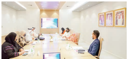
○ اجتماع المجلس الأعلى للمرأة ومعهد الإدارة العامة.

قام سمو الشيخ خليفة بن زايد آل نهيان رئيس الدولة، حفظه الله، خلال جولته الميدانية بمنطقة الجبر، في بادئ الزيارة، أكد سموه على أهمية مواصلة الزيارات لمختلف المناطق لتحسين مستوى الخدمات المقدمة للمواطنين والأهالي، مشيراً إلى أن مواكبة التطور التكنولوجي مهم لمواصلة مملكة البحرين سعياً الطموح لتحقيق أهدافها التنموية الشاملة وتطلعاتها في مجال تقنية المعلومات والاتصالات بما يعزز من مكانة المملكة على المستويات الإقليمية والعالمية، منوهاً سموه بدور الشركات العالمية في رفد قطاع تقنية المعلومات والاتصالات بأحدث التقنيات المطورة وفقاً لآخر المستجدات، ومشيداً بدور