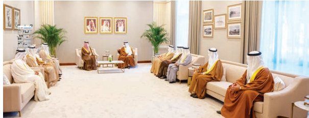
سمو ولي العهد رئيس مجلس الوزراء خلال استقباله وزراء مالية دول مجلس التعاون.

المجلس ولي العهد رئيس مجلس الوزراء على مشاعر سموه الطبية، وديم عليها عز وجل أن يحفظ مملكة البحرين وشعبها ويدعم عليها نعمة الأمن والاستقرار.