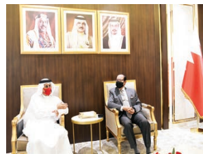
○ رئيس مالية الشورى يستقبل وزير الصناعة والتجارة والسياحة.

بعث حضرة صاحب الجلالة الملك حمد بن عيسى آل خليفة عاهل البلاد المفدى، برفقة نوهته إلى جلالة الملك نورودم سيهانولي ملك مملكة كمبوديا، بمناسبة ذكرى استقلال بلاده، أعرب جلالتهم عن أطيب تهانيه وتمنياته له موفور الصحة والسعادة بهذه المناسبة الوطنية. وبعث صاحب السمو الملكي الأمير سلمان بن حمد آل خليفة وولي العهد رئيس مجلس الوزراء برفقة نوهته إلى جلالة الملك نورودم سيهانولي ملك مملكة كمبوديا بمناسبة ذكرى استقلال بلاده، أعرب سموه في البرقية عن أطيب تهانيه وتمنياته له موفور الصحة والسعادة بهذه المناسبة الوطنية. كما بعث صاحب السمو الملكي ولي العهد رئيس مجلس الوزراء برفقة نوهته ماثلة إلى السيد هو سين رئيس وزراء مملكة كمبوديا.