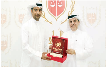
تكريم المشاركين في ورشة العمل.

إلى إدارة شبكة الدعارة، كما عثر على ٣ فتيات يتم استغلالهن في أعمال الدعارة وقالت أجهان إنها تنتمي إلى أسرة فقيرة وأن المتهمه ألقبها بتوفير فرص عمل لها في البحرين عن طريق إعلان على مواقع التواصل الاجتماعي وبعد حضورها أخذت منها جواز سفرها وطبقت عليها سداد ١٥٠٠ دينار للحصول عليه مجددا، بالإضافة إلى ١٢٠ دينار إيجارا شهريا للمساكن وتوفير الأكل والوسر، حيث عملت في الدعارة بمعدل يتراوح ما بين ١٠ دنانير و ٦٠ دينار، وأسندت التوبة إلى المتهمين أنهم لم يتفقوا على دفع مبلغ ١٠٠٠ دينار، حيث عملت عليهم بإن قاموا بتفويض والبرهان بعرض إساءة استغلالها في ممارسة الدعارة، والتحدث بنقده والتهميد والحللة حال قضفها في حالة ظرفية وشخصية لا يمكن معها الاعتماد برضاها واختيارها، كما نقلوا وأوا الجهات عليهن بعرض استغلالهن في الدعارة وذلك بطريق الإكراه والحيلة والتهميد، والاعتماد على ما تكسبنه بانتأثرها عليها والسيطرة عليها لممارسة الاعتماده وتحريض المجني عليهن على ارتكاب الدعارة والمساعدة على ارتكاب الدعارة.