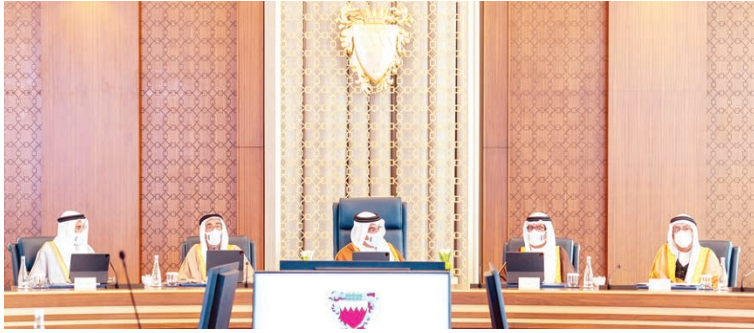
سمو ولي العهد رئيس مجلس الوزراء خلال رئوسه جلسة مجلس الوزراء.