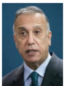
رئيس وزراء العراق.

المجلس ولي العهد رئيس مجلس الوزراء على مشاعر سموه الطبية، وديم عليها عز وجل أن يحفظ مملكة البحرين وشعبها ويدعم عليها نعمة الأمن والاستقرار.