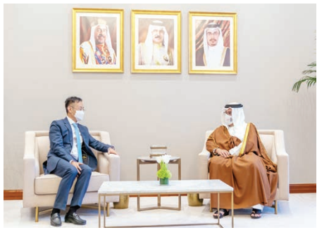
○ سمو ولي العهد رئيس الوزراء يستقبل رئيس شركة هاواي في الشرق الأوسط وشمال إفريقيا.

بحضور الشيخ سلمان بن حمد خليفة آل خليفة وزير المالية والاقتصاد الوطني والسيد كمال بن أحمد محمد وزير المواصلات والاتصالات، السيد ستيفن بي عضو مجلس الإشراف ورئيس شركة هاواي في الشرق الأوسط وشمال أفريقيا، حيث أشار سموه إلى أن مواكبة التطور التكنولوجي مهم لمواصلة مملكة البحرين سعياً الطموح لتحقيق أهدافها التنموية الشاملة وتطلعاتها في مجال تقنية المعلومات والاتصالات بما يعزز من مكانة المملكة على المستويات الإقليمية والعالمية، منوهاً سموه بدور الشركات العالمية في رفد قطاع تقنية المعلومات والاتصالات بأحدث التقنيات المطورة وفقاً لآخر المستجدات، ومشيداً بدور