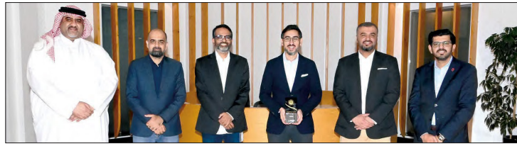
من جوائز الإنجاز التكنولوجي لمنطقة الشرق الأوسط وأفريقيا

الشراكة معلماً بارزاً للبحرين في جهودها المستمرة لارتقاء جودة التعليم في المملكة وخلق فرص جديدة للجيل القادم من الطلاب المحليين والدوليين لخوض تجربة تعليم عال على مستوى عالمي». وعلمت الدكتورة إريكا د. بيك، رئيس جامعة ولاية كاليفورنيا - نورثريدج: «تقوم جامعة ولاية كاليفورنيا - نورثريدج بتدريب أعداد كبيرة من طلاب الماجستير أكثر من باقي الجامعات التي تقدم البرامج نفسها تقريباً. إن وجود هيئة طلابية دولية متنوعة يثري تجربة الطلاب وهي سمة مميزة للتعليم في جامعة ولاية كاليفورنيا - نورثريدج».