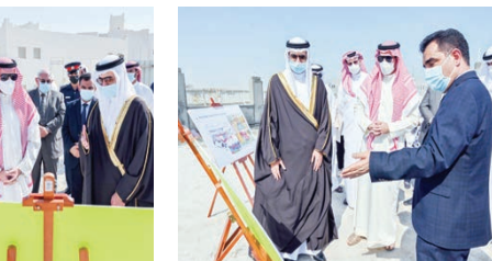
○ سمو محافظ الجنوبية خلال جولته الميدانية بمنطقة الجبر.