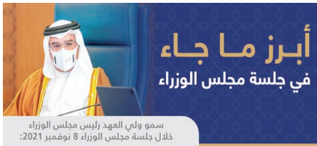
سمو ولي العهد رئيس مجلس الوزراء خلال جلسة مجلس الوزراء 8 نوفمبر 2021.