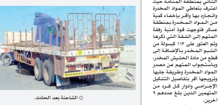
الشاحنة بعد الحادث.

كتب: عبدالأمير السلطنة شهد جسر سترة ظهر أمس (الثلاثاء) حالة ارتباك في حركة السير إثر حوادث مرورية من دون وقوع إصابات. كان أسبوي في وقت ضاحية كبيرة في الساعة الثانية عشر والنصف من ظهر أمس على جسر سترة وقعد السيطرة على عجلة القيادة واصطدم بالسياح الحديدية، نتج عن الحادث تصدع الشاحنة والسياح الحديدية من دون أن تسجل أي إصابات. وقرر وقوع الحادث حضرت شرطة النجدة وقام أفرادها بتسييل سير السيارات التي وصل وحصول شرطة المرور وتم إزاحة الشاحنة التي تسببت في ارتباك بحركة السير، وفتحت الجهات الرسمية التحقيق لمعرفة أسباب الحادث.